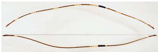
sopra forma scarico; sotto forma incordato

Ecco come si presenta la sezione dello Yumi dopo l'incollaggio e la sagomatura. Fra le due aste di bambù è racchiusa un'anima composta da listelli intervallati di bambù e legno. La parte interna, in questo caso, è di soli tre listelli, che possono essere aumentati a 4, 5 e oltre, con diverse possibilità di composizione fra bambù e legno. Queste differenti scelte riguardo alla composizione interna dipendono da molti fattori: l'epoca, la qualità del materiale, il modello di Yumi che si vuole ottenere, ecc. Un maggior numero di sezioni nel nucleo è considerato un pregio per la migliore morbidezza e adattabilità al tipo di tecnica utilizzata dall'arciere.